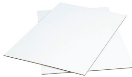
Du papier épais ou du carton