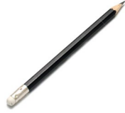
Un crayon de plomb et une gomme à effacer