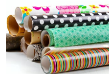
D'autre type de papier recyclé et coloré comme du papier d'emballage ou de vieux journaux