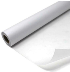
Du papier calque