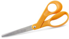
Des ciseaux pour découper le papier

Étape 1 : Rassemble d'abord les fournitures suivantes :