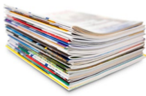
Des vieilles revues