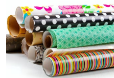
کاغذ رنگی‌های بازیافت شده مانند کاغذ کادو یا روزنامه‌های قدیمی